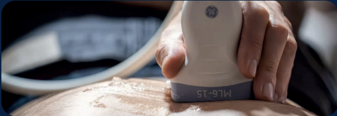
ECOGRAFÍA BÁSICA Carlos Alonso Calvar 5, 6, 7, 8 marzo 2026