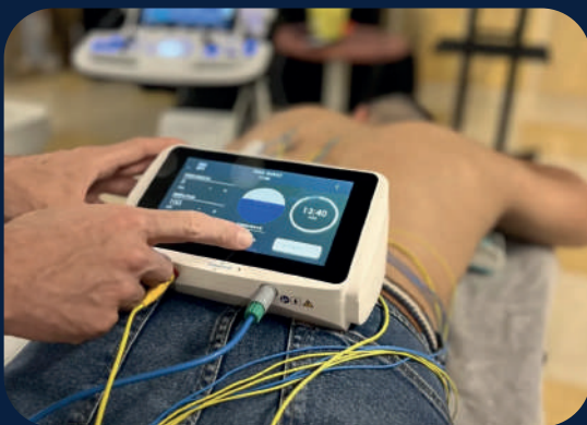
ELECTROLISIS I y II Javier Gonzalez Iglesias Seminario I 27, 28, 29 marzo 2026 Seminario II 10, 11, 12 abril 2026